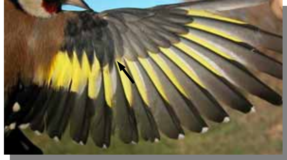
Jilguero. Macho. Muda postjuvenil. Ala de 1º año.