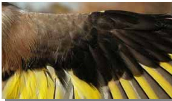
Jilguero. Hembra: diseño de las pequeñas coberteras.