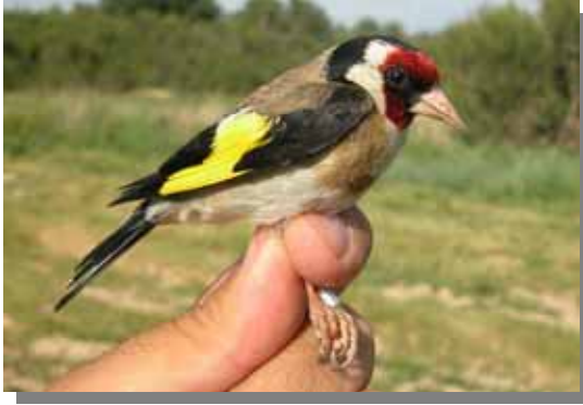
Jilguero. Macho. 11 de diciembre.