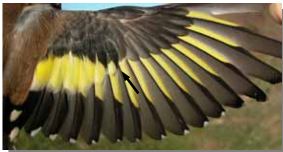
Jilguero. Hembra. Muda postjuvenil. Ala de 1º año.