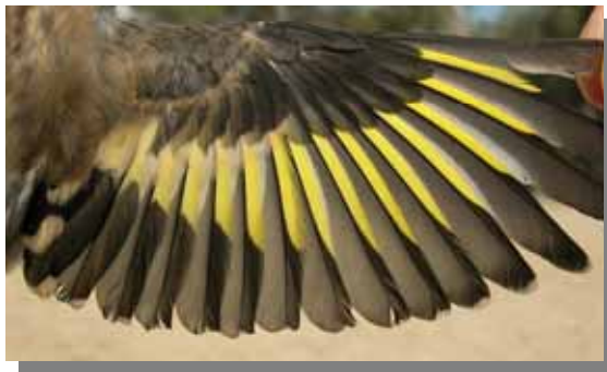
Jilguero. Ala de juvenil.