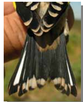
Jilguero. Verano. Diseño de la cola: izquierda adulto; derecha juvenil.