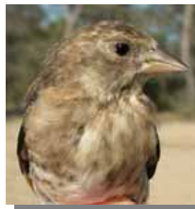
Jilguero. Diseño del pecho: arriba izquierda macho; arriba derecha hembra; izquierda juvenil