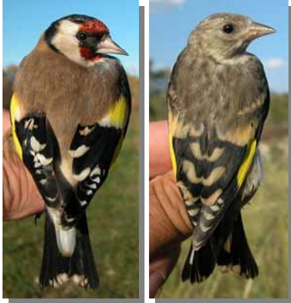
Jilguero. Diseño del dorso: izquierda adulto derecha juvenil.