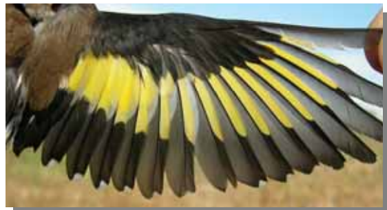
Jilguero. Macho. Muda postnupcial. Ala de adulto