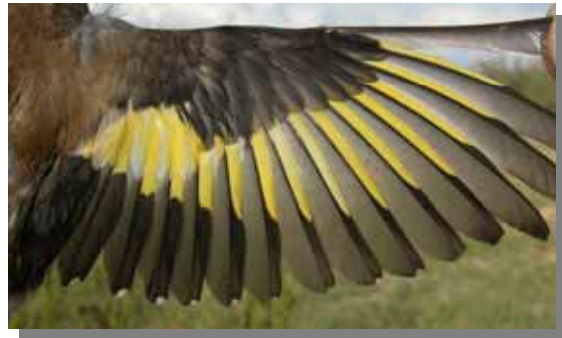
Jilguero. Hembra. Muda postnupcial. Ala de adulto.