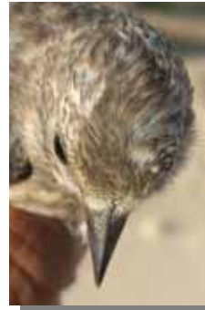
Jilguero. Diseño del capirote: arriba izquierda macho; arriba derecha hembra; izquierda juvenil.