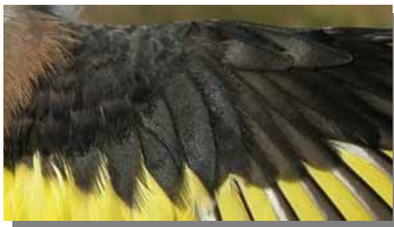
Jilguero. Macho: diseño de las pequeñas coberteras.