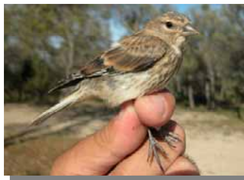
Pardillo común. Juvenil.

Presente todo el año, con aporte de migrantes en invierno. Repartido por toda la Comunidad, falta únicamente en algunas zonas del Pirineo y Depresión del Ebro.