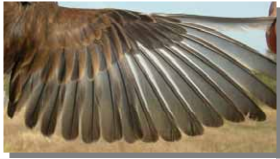
Pardillo común. Hembra. Muda postnupcial: ala de adulto.