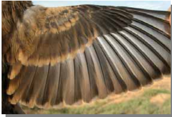
Pardillo común. Hembra. Ala de juvenil.