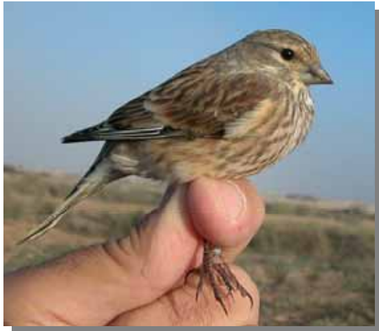
Pardillo común. Invierno. Macho.