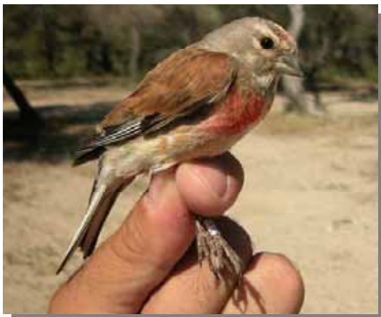
Pardillo común. Primavera. Macho. 1 de junio.