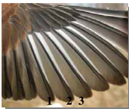
Pardillo común. Diseño del color blanco en las primarias 1 a 3: arriba macho; abajo hembra.