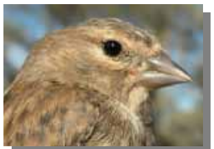
Pardillo común. Diseño de la cabeza: arriba izquierda macho en primavera; arriba derecha macho en invierno; izquierda hembra; abajo juvenil.