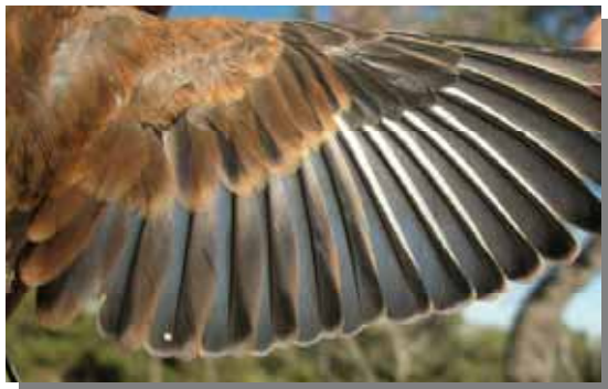
Pardillo común. Macho. Ala de juvenil.