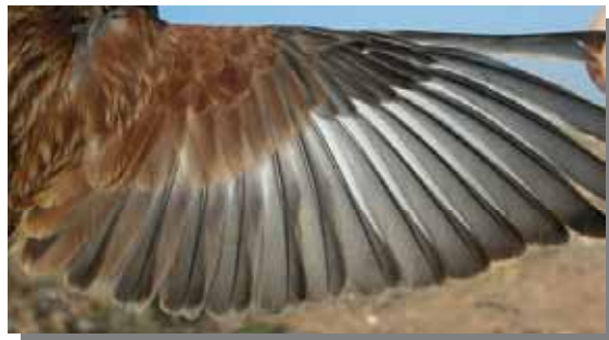
Pardillo común. Macho. Muda postnupcial: ala de adulto.