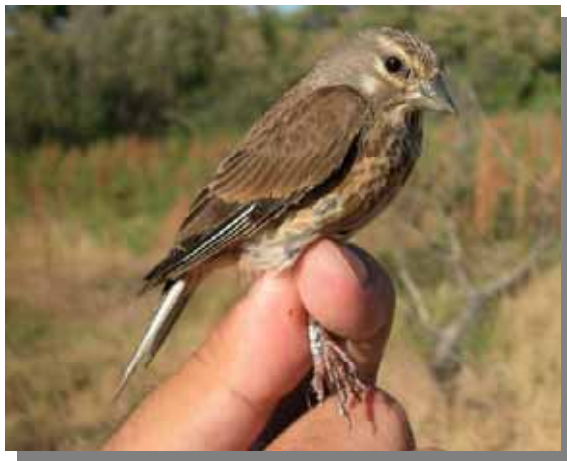
Pardillo común. Hembra.