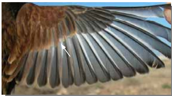
Pardillo común. Macho. Muda postjuvenil: ala de 2º año.