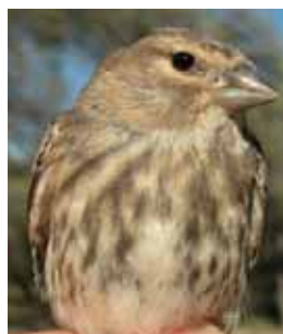
Pardillo común. Diseño de cabeza y pecho. Arriba izquierda macho en primavera; arriba derecha macho en invierno; izquierda hembra; abajo juvenil.