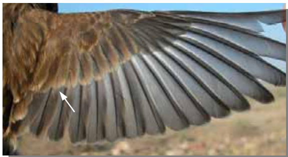
Pardillo común. Hembra. Muda postjuvenil: ala de 1º año.