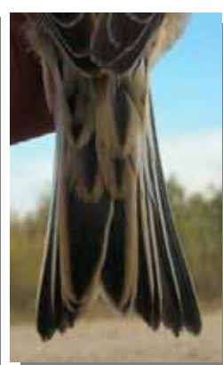
Pardillo común. Desgaste de la cola en otoño: izquierda adulto/1º año; derecha 1º año.